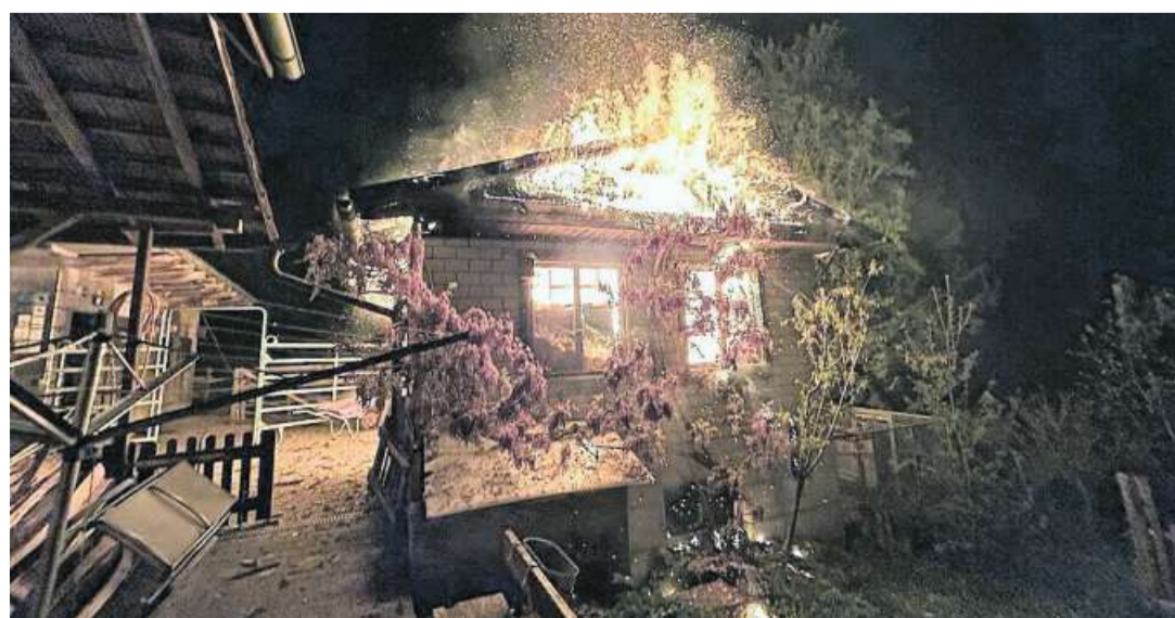
Beim Eintreffen der Rettungskräfte stand der Schopf bereits in Vollbrand.

Zudem konnten, dank dem schnellen Eingreifen der Rettungskräfte, sämtliche Tiere aus dem Schopf gerettet werden. Auch Personen blieben beim Brand unversehrt. Die Brandursache ist zur Zeit noch unklar. Die Kantonspolizei hat Ermittlungen aufgenommen. (cam)